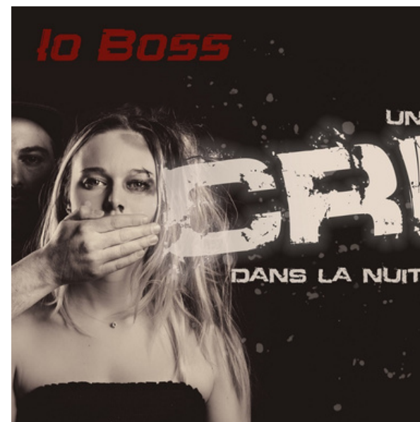
Par lo Boss.